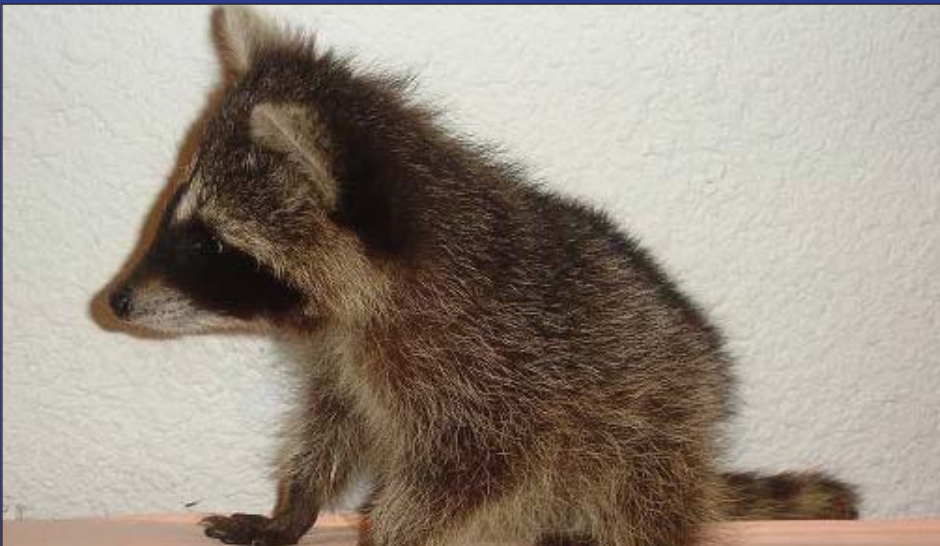
Tout p'fit avec de grandes z'oreilles !