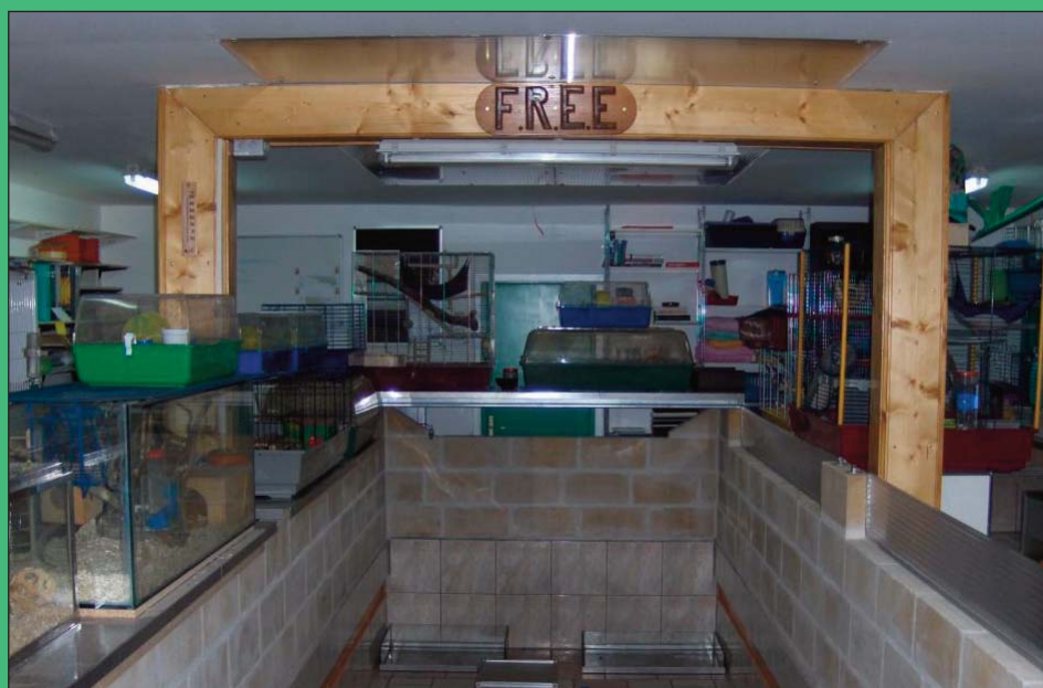
Ha bah oui, ça fait du monde...

recueillons les animaux trouvés errants (par des particuliers, des services publics, les sociétés de fourrière, ou par d'autres associations non spécialisées, etc.) ou déposés au refuge par leurs propriétaires qui ne peuvent plus les garder (difficultés sociales, déménagements, accidents de santé, mauvaise information à l'achat, problèmes familiaux, etc.), sous contrat de cession. Parfois nous "remettons en forme" ou resocialisons les animaux qui le nécessitent. Ceux qui sont adoptables sont placés en suite à l'adoption (sous contrat d'adoption) et ceux qui ne sont pas adoptables sont placés en parrainage (sous contrat de parrainage) pour aider à leur prise en charge. Un service de garde pour les vacances (interne aux adhérents) a aussi été mis en place ; tout en restant à échelle familiale, ceci représente un effectif