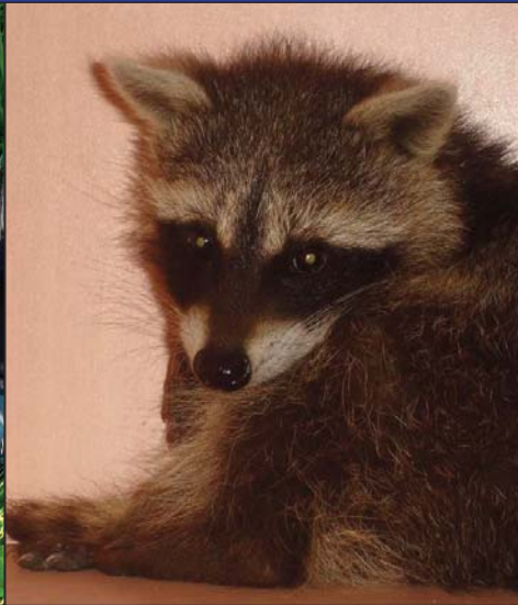
Bonjour Luckyyyy !