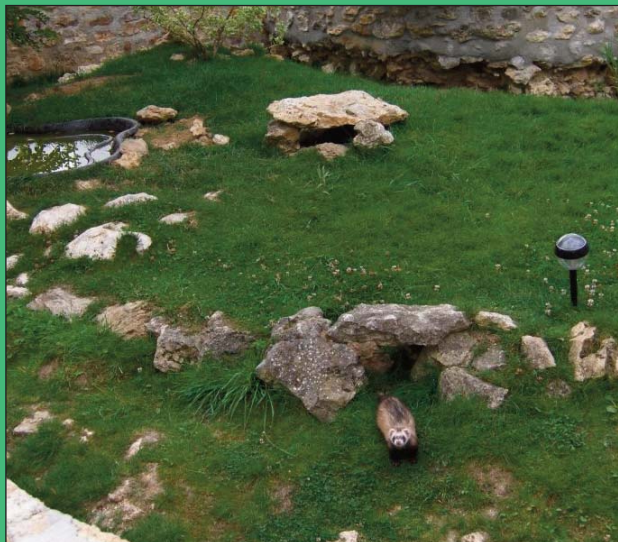
Un enclos pour les furets... piscine, éclairage, tout y est !

Située en région parisienne, l'association F.R.E.E. est un refuge spécialisé dans les Petits Animaux de Compagnie ; existant depuis novembre 2001, son sigle est " Furets, Rongeurs, Etc., Etc. ".