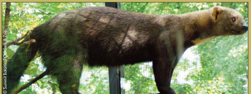
Un tayra dans un zoo du Panamá