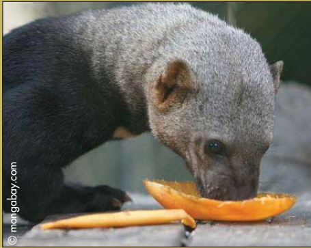
Carnivore certes, mais gourmand de fruits aussi !

Découvrons le tayra... Et là, je vois bien que vous pensez à une blague !