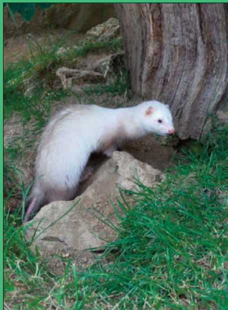
Le room-service se fait attendre !

chat où de chien déjà en place dans la famille, ou de rongeurs vivant séparément des furets).