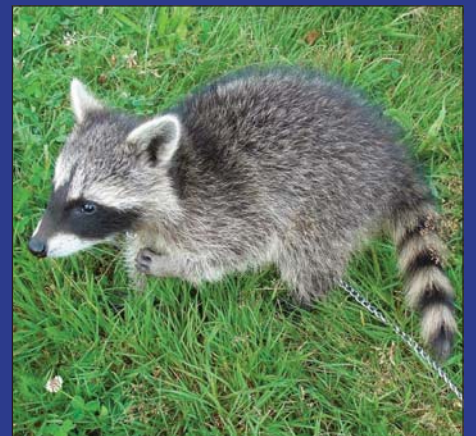
J'finis d'me gratter et j'attaque !