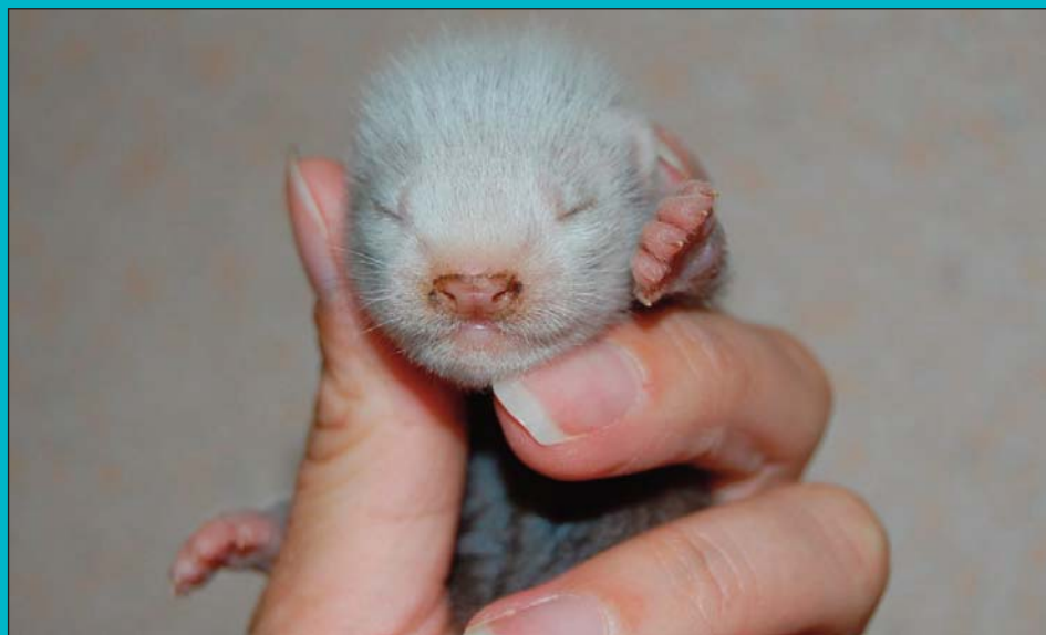
Mais qu'est-ce que j'fous là ?!