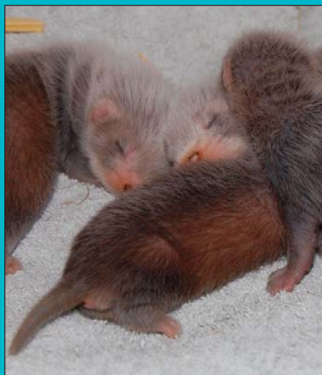
Sur la serviette emberlificotés... lalalala...