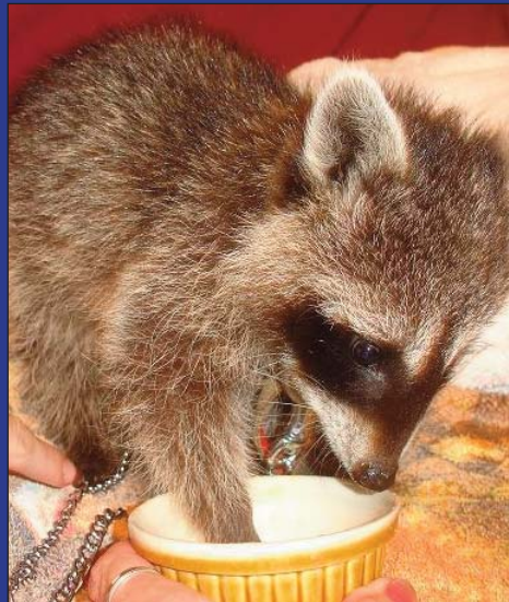
A table !