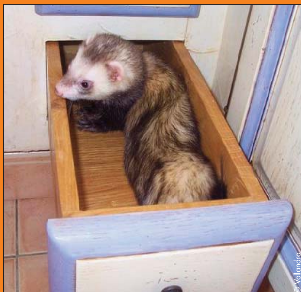
Ouais ! Mon tiroir à mmmmmooooouaaaa !