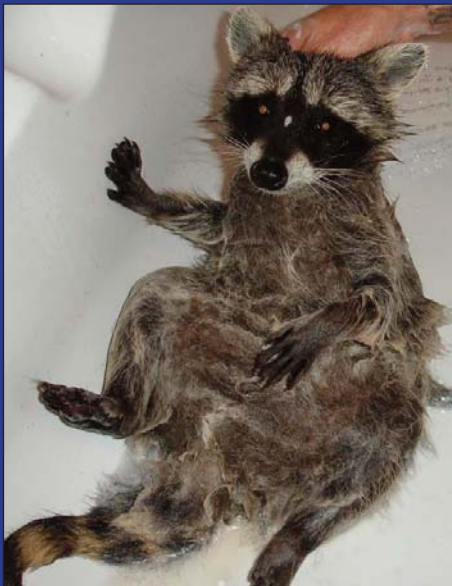
Shampooing cheveux secs s'te plaît !

C'est un peu comme un chat ou un chien dans le sens où il est propre, très joueur et très affectueux mais je reste vigilante car c'est un animal sauvage et ça, il ne faut pas l'oublier. Je ne le laisse jamais seul avec mes enfants ou mes animaux, il est toujours sous surveillance. J'ai la chance de faire