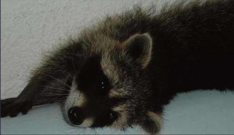
Un câlin ou un gage !