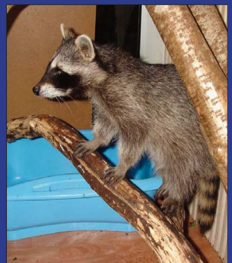
Des fois, j'me la joue Tarzan d'la jungle...

J'ai pris une semaine de congé pour m'occuper de lui à temps complet, à la fin de sa première semaine, Lucky a commencé à reconnaître son nom, il a fait connaissance avec les autres animaux, car la plupart de mes animaux sont en liberté. Avec les chats et les chiens, ça se passe bien, mais avec les iguanes ça passe un peu moins bien... il faut savoir que dans la nature un raton laveur se nourrit de lézards !